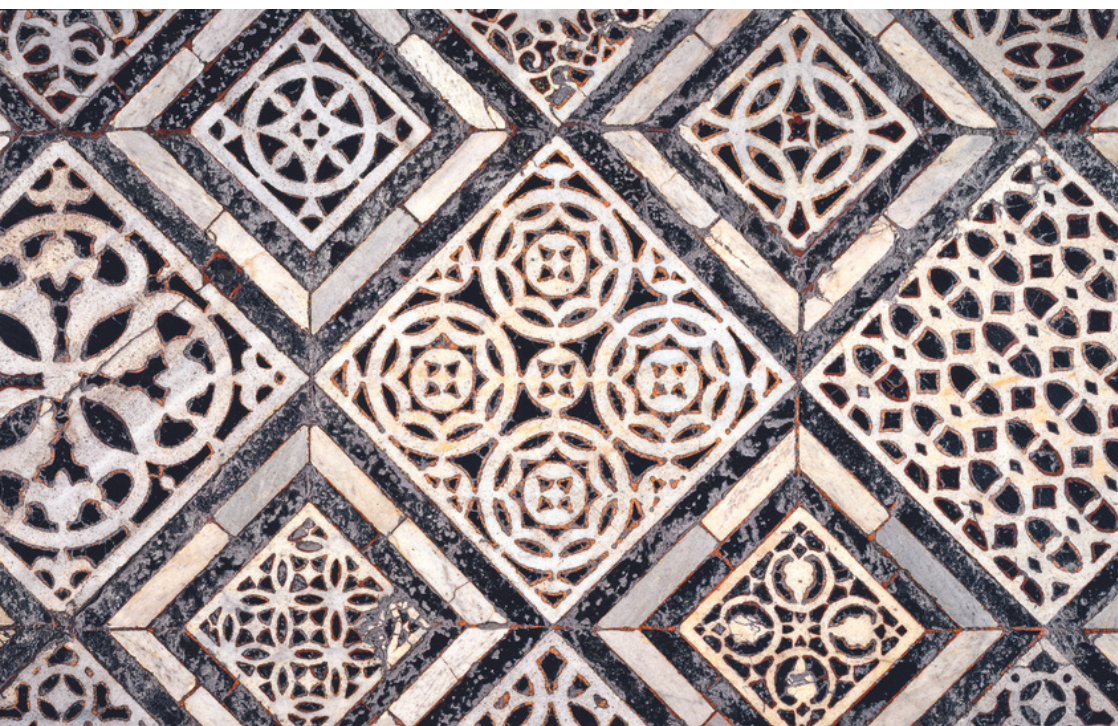
Particolare del pavimento in tarsia marmorea del Battistero di Firenze

5 mattine di visite museali, itinerari all'aperto e laboratori manuali